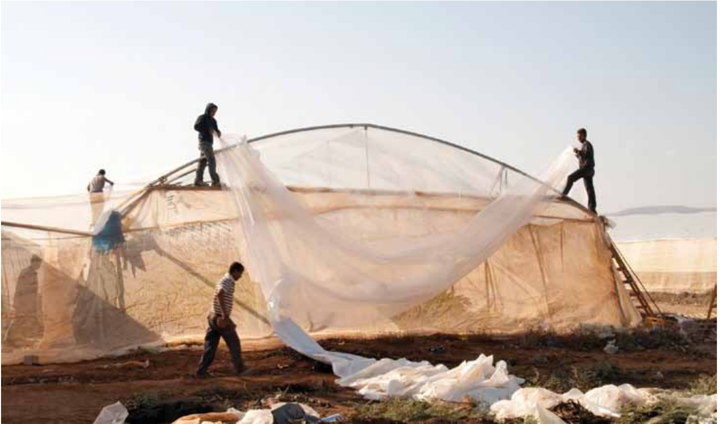
▲ November 2008, Palästinenser erbauen ein Gewächshaus, in einem israelischen Siedlungshof im Jordantal.

Von palästinensischen Bauern zum Auffangen von Regenwasser genutzte Zisternen werden von den israelischen Behörden häufig zerstört (46 allein in 2011), und so die Erzielung eines landwirtschaftlichen Ertrages zusätzlich behindert. 43 Darüber hinaus, sind in den vergangenen Jahren zunehmend mehr Wasserquellen auf palästinensischem Boden in der Umgebung von Siedlungen durch Siedler in Besitz genommen worden, die daraufhin Palästinensern den Zugang verweigerten. 44