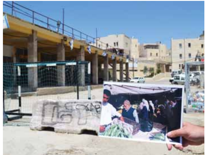
▲ Eine Fotografie hebt das Leben in einem belebten Markt Hebrons von 1999 im Kontrast zum Leben in der Straße heute vor. Die Altstadt von Hebron wurde für Palästinenser geschlossen und hat somit die Stadt in eine Geisterstadt verwandelt.