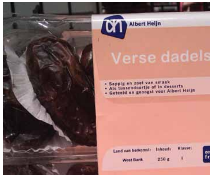
▲ Datteln zum Verkauf in den Niederlanden. Der Aufkleber sagt "West Bank" welches den Konsumenten im Unklaren lässt, ob die Früchte aus israelischen Siedlungen kommen oder von Palästinensischen Siedlungen. Auf Nachfrage sagt der Verkäufer, dass die Datteln aus der Tomer Siedlung im Jordantal kommen.

Der größte israelische Dattlexporteur ist die Firma Hadiklaim. Hadiklaim weist offenbar alle Datteln als israelische Erzeugnisse aus, und macht es damit schwer für den Verbraucher, zwischen Datteln aus dem israelischen Kernland und aus dem besetzten Jordantal zu unterscheiden.