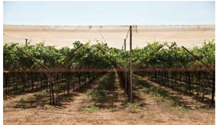
▲ Weingüter die Teil einer israelischen Siedlung sind im Jordantal im Westjordanland, gebaut auf beschlagnahmten palästinensischem Gebiet.

Die meisten Siedlungen werden von Israel als „Gebiete mit nationaler Priorität“ klassifiziert, und haben dadurch Anspruch auf eine Bandbreite von finanziellen Zuwendungen und Subventionen, unter anderem für den Bau von Wohnhäusern sowie den Ausbau von Bildung und lokaler Entwicklung. Die Zuschussleistungen für Siedler sind wesentlich höher als die für in den Grenzen von 1967 lebende Israelis. Der israelischen NRO Peace Now zufolge stellt die israelische Regierung für Zuwendungen für Siedler pro Jahr mindestens 1,6 Milliarden Schekel (330 Mio. €) mehr zur Verfügung als für Zuwendungen für im israelischen Kernland lebende Israelis. Darin sind die beträchtlichen Ausgaben für die Sicherheit der Siedlungen nicht enthalten. Die Pro-Kopf-Zuwendungen der Regierung für die lokale Verwaltung der Siedlungen lagen mehr als doppelt so hoch wie innerhalb Israels, während die Ausgaben für Bildung pro Schüler in den Siedlungen 63% höher waren. 75