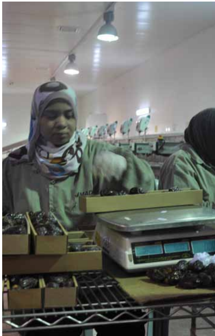
▲ Arbeiter sortieren Datteln für den Export bei “Nakheel Palestine for Agricultural Investment”.

Dennoch: Bis die den Palästinensern im Jordantal von Israel auferlegten Hindernisse außer Kraft gesetzt sind, ist es unwahrscheinlich, dass die Firma ihr ganzes Potenzial entfalten kann.