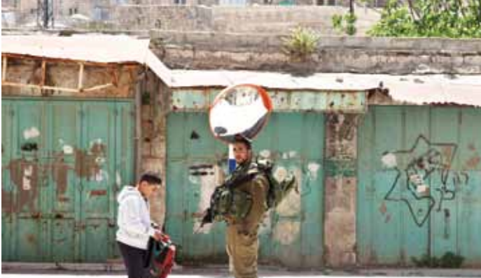
▲ Ein israelischer Soldat durchsucht die Schultasche eines palästinensischen Jungen in Hebron. Der Junge gehört zu einer der letzten palästinensischen Familien im alten Zentrum von Hebron. Palästinenser, die nicht in der Altstadt wohnen, dürfen nur durch eine begrenzte Anzahl Straßen die Stadt erreichen.

Siedlungen sind israelische Gemeinschaften, die in den von Israel seit dem Sechstagekrieg von 1967 besetzt gehaltenen Gebieten errichtet werden. Unterstützt werden die Siedlungen durch eine Infrastruktur, zu der beispielsweise gesonderte Straßen, Checkpoints und die Sperranlage, die sie von der umliegend angesiedelten palästinensischen Bevölkerung trennt, zählen. Siedlungen verstoßen gegen internationales Recht sowie gegen Resolutionen des UN-Sicherheitsrates, und doch hat in den 45 Jahren der Besatzung der palästinensischen Gebiete durch Israel jede israelische Regierung ihren weiteren Ausbau gefördert.