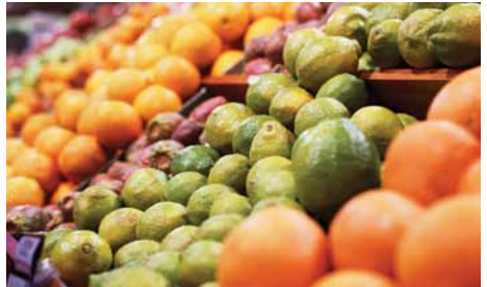
▲ Nahansicht von Zitrusfrüchten im Supermarkt.

Abgesehen von frischen Erzeugnissen wird eine Reihe in Europa verkaufter israelischer Weine aus in Siedlungen angebauten Trauben hergestellt. Der israelischen NRO Who Profits zufolge haben alle großen israelischen Weinkellereien, die nach Europa exportieren, Weingüter in den besetzten Golanhöhen; die meisten von ihnen außerdem im Westjordanland. 106 Zu den Nahrungsmittelbetrieben aus Siedlungen im Westjordanland, die nach Europa exportieren, gehören Achdut (Hersteller von Achva Halva) und Adanim Tea (Kräutertees). 107