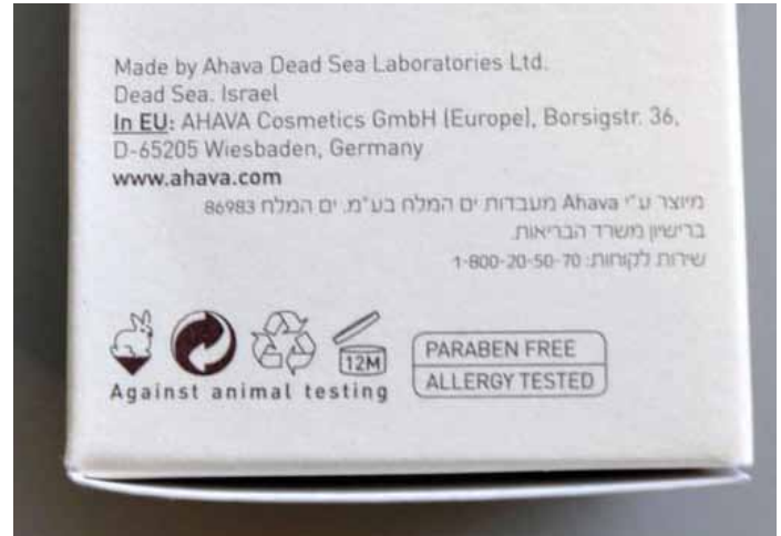
▲ Die Firma Ahava kennzeichnet ihre Produkte mit "Made in Israel" trotz der Tatsache, dass diese in Siedlungen in den besetzten palästinensischen Gebieten hergestellt werden. Die Postleitzahl 86983, welche in kleinen Buchstaben auf der Verpackung angezeigt ist, ist die Postleitzahl der israelischen Siedlung Mitzpe Shalem am Toten Meer.