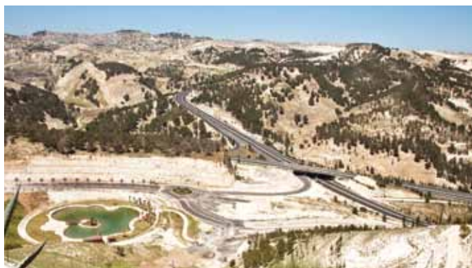
▲ Eine Israelische Siedlung im Außenbereich von Ostjerusalem. Siedlungen werden um die Stadt gebaut und schneiden somit das palästinensische Ostjerusalem von dem Westjordanland ab. Trotz weitverbreiteter Wasserknappheit in den palästinensischen Gemeinden prahlen viele dieser Siedlungen mit Schwimmbädern und Wasseranlagen.

In der überwältigenden Mehrheit der Rettungswagen Transporte müssen die Patienten an einem Checkpoint von einem palästinensischen Rettungswagen in einen israelischen Rettungswagen verlegt werden, bevor sie nach Jerusalem einreisen. 34