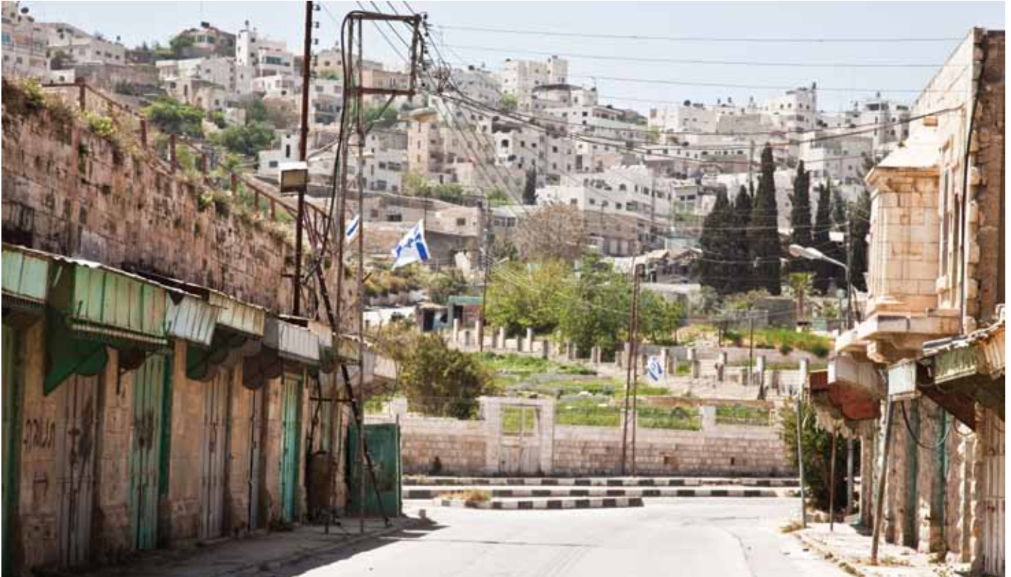
▲ Den Palästinensern ist der Zutritt zu einigen Straßen in der Altstadt von Hebron verboten, auf Grund der Anwesenheit von Siedlern in dem Zentrum der Stadt. Straßen wie diese waren einst belebte Märkte und sind nun menschenleer.