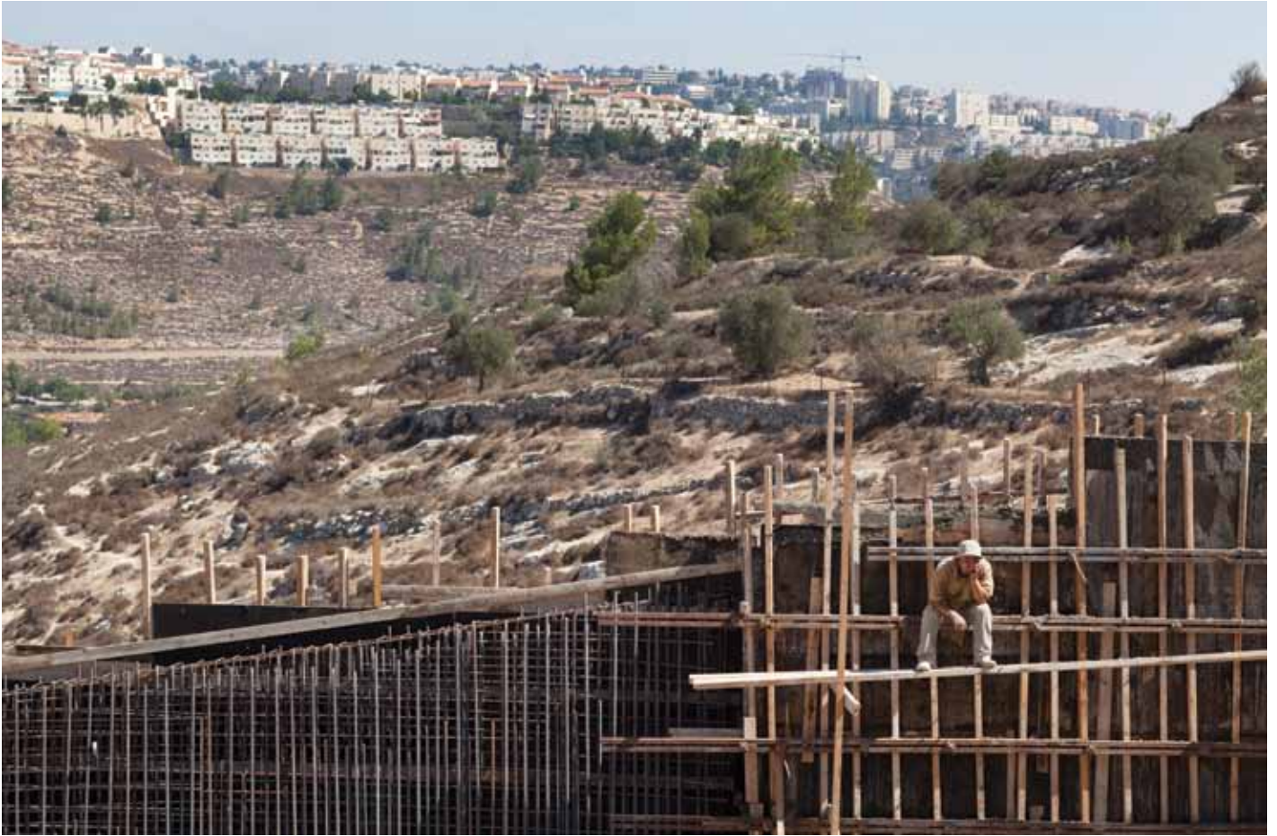
▲ Der Abbruch der Mauer in dem Palästinensischen Dorf von Al Walaje, welches von tausenden von Siedlungseinheiten umringt wird in dem Gush Etzion Block.