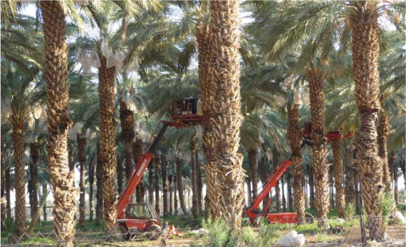
▲ Palästinenser ernten Datteln in der Tomer Siedlung, Jordantal.